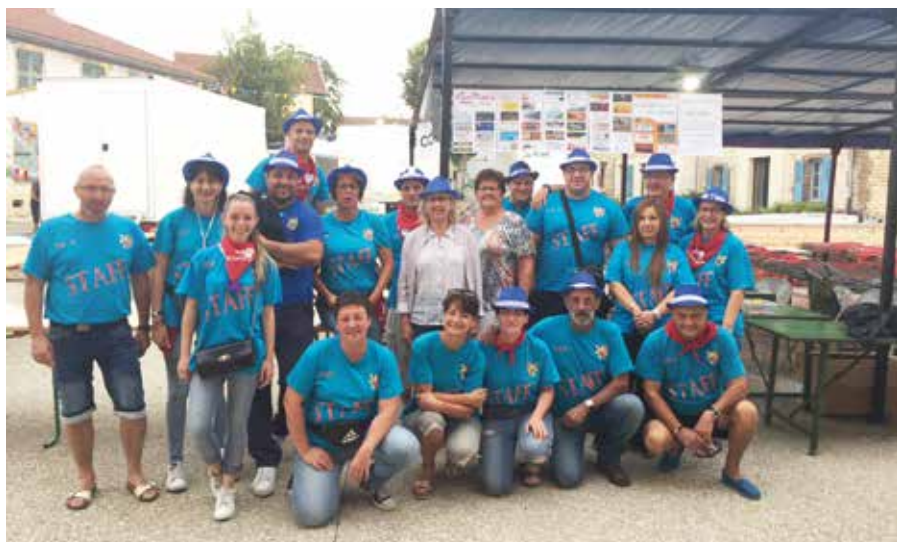
L'équipe du Comité