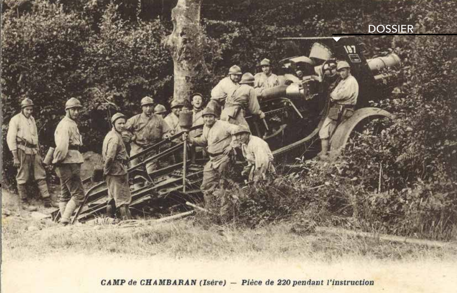
CAMP de CHAMBARAN (Isère) — Pièce de 220 pendant l'instruction