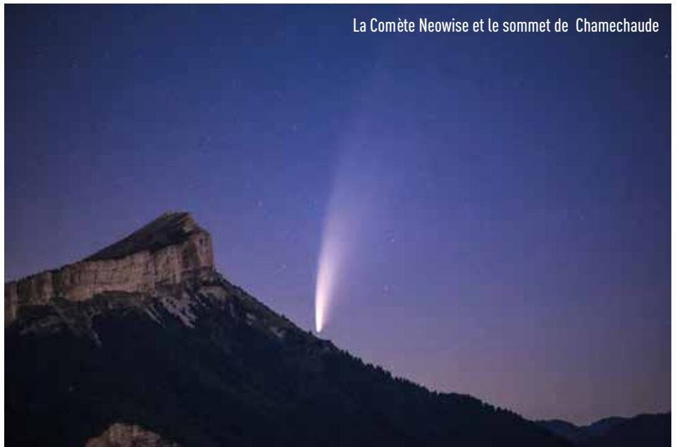
La Comète Neowise et le sommet de Chamechaude

En juillet dernier, Saint-Égrève a tout naturellement fait partie de 23 villes qui ont signé cette "Charte d'engagement lumière". Et l'enjeu est de taille, puisqu'elles comptent, à elles seules, 44 000 luminaires publics sur les 67 000 recensés sur la métropole. La rénovation d'un tel patrimoine est par ailleurs susceptible de générer une économie de 15 à 21 millions d'euros sur les quinze prochaines années. D'autant plus que ce parc est globalement vétuste puisque le Syndicat de l'éclairage estime qu'au moins 40% des luminaires en service ont plus de 25 ans. La marge de progression est donc importante grâce notamment à l'utilisation d'éclairages led plus efficaces que les lampes à vapeur de