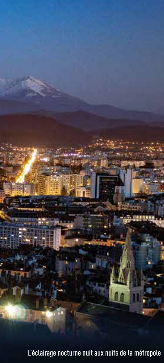
L'éclairage nocturne nuit aux nuits de la métropole

rés "non stop" participent à illuminer les nuits. Mais si les êtres humains y gagnent en sécurité (ou, à tout le moins, en ont le sentiment), les dommages collatéraux de ces lumières tous azimuts sont bel et bien réels. Avec une croissance moyenne estimée de 6% par an et de 10% dans les pays européens, la pollution lumineuse est l'une de celles qui se développe le plus dans le monde. La "pollution lumineuse écologique" provient de l'éclairage public et routier qui, dans le cadre de la prévention routière et anti-criminalité, est utilisé à des intensités lumineuses qui excèdent bien souvent les minimums requis. Mais elle est aussi produite par l'éclairage des bâtiments industriels et commerciaux, des parkings et des centres sportifs, des habitations ainsi que des véhicules.