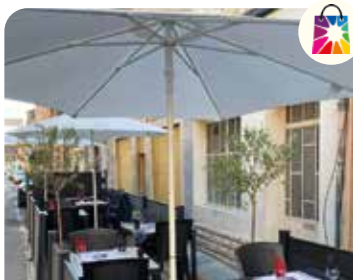
Le Soleil d'Orient 06 37 75 32 16