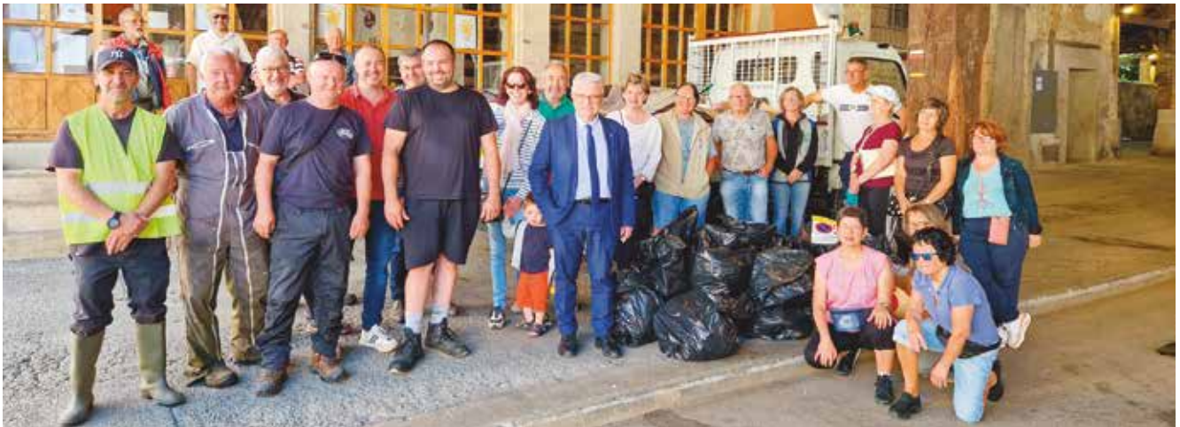
3 m 3 de déchets collectés lors de l'opération "Ville propre", bravo à tous !