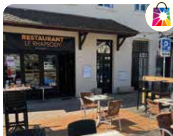
Le Rhapsody 09 61 64 69 27