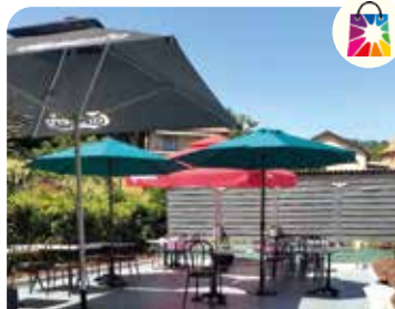
Au Pressoir 04 74 20 40 32