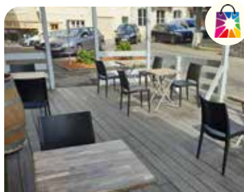
Cave Di'Vins 04 74 85 27 80