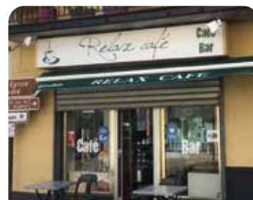
Relax Café 04 74 20 43 24