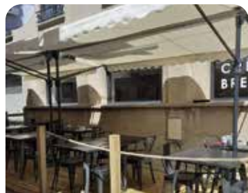
Au Blé Noir 04 74 59 94 69

Il y a tout ce que vous voulez à la Côte Saint-André