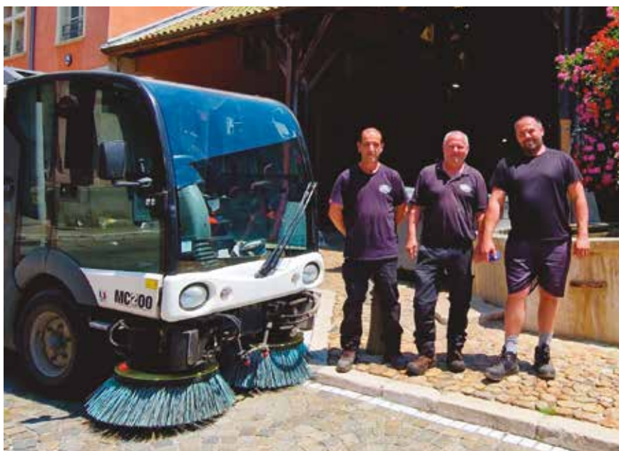
3 agents œuvrent chaque jour à temps plein pour le maintien de la propreté de la ville.

Les équipes de propreté de la ville s'activent au quotidien pour garantir un cadre agréable aux Côtôis. Elles travaillent quotidiennement pour maintenir propre l'environnement de La ville. Ces agents œuvrent pour nettoyer les rues, les trottoirs, vider les poubelles de rues, évacuer les encombrants déposés dans les locaux poubelles, avec l'équipe des espaces verts. Ils contribuent ainsi à créer un environnement agréable pour tous. Leur travail souvent discret est essentiel pour préserver notre qualité de vie. Il est primordial de reconnaître leur engagement et de respecter leur travail en évitant de salir ou de dégrader les lieux publics