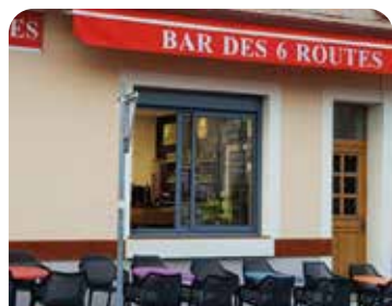
Bar des 6 routes 04 74 20 10 55