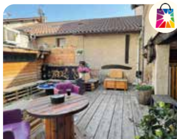
L'Abreuvoir 06 20 78 79 56