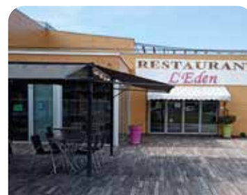
L'Eden 04 74 56 22 75