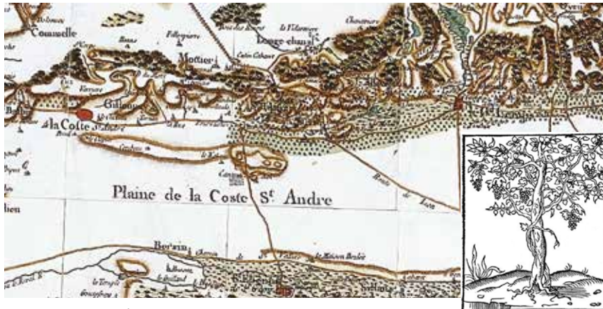
Carte de Cassini, établie entre 1750 et 1784