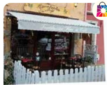
Flore de café 07 68 08 38 02