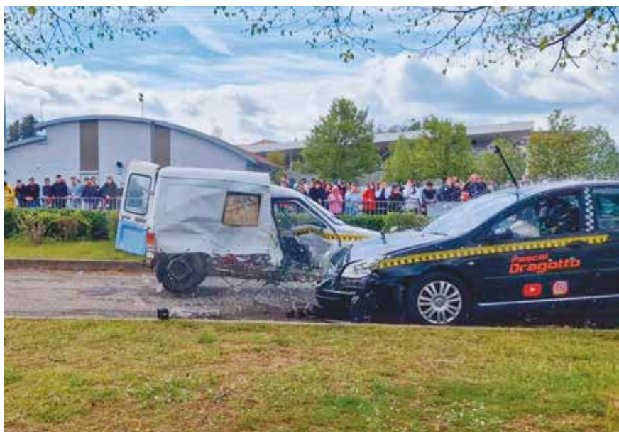
400 collégiens et lycéens ont assisté à la démonstration de crash-test

Une semaine autour de la sécurité routière a été organisée par les acteurs prévention de la Ville (CCAS / Police Municipale) du 24 au 28 avril 2023. L'objectif était de sensibiliser tout particulièrement les jeunes aux dangers des conduites à risques et aux effets de l'alcool et des drogues sur la conduite. Les bonnes pratiques d'utilisation des 2 roues et des vélos et vélos à assistance électrique ont également été mises en avant. Au total près de 400 jeunes collégiens et lycéens ont ainsi assisté à la démonstration de crash-test, largement relayée sur les réseaux sociaux. 250 jeunes environ ont assisté à l'opération de désincarcération proposée par le SDIS.