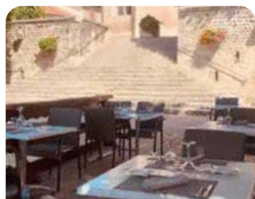
Hotel de France 04 74 20 25 99