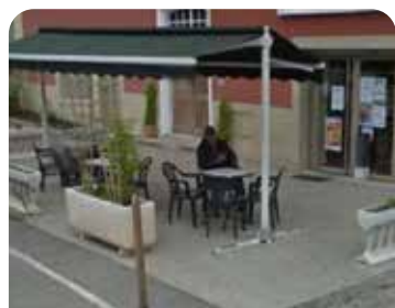
Le Ginkgo Bar 04 74 20 22 11