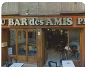
Bar des amis 04 74 48 63 44